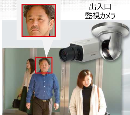
出入口 監視カメラ