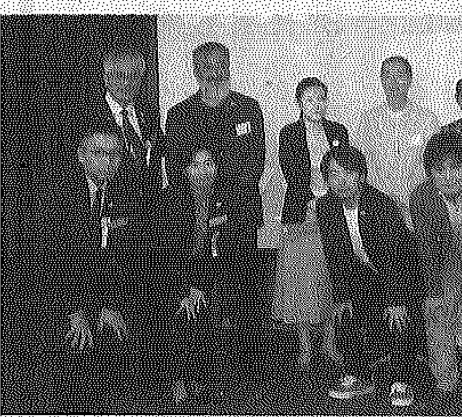
今回認定された職業専門員

ため、脱法思考を排除し、官民で基準を作り出す。この総会では先輩諸氏の職業専門家を工業会認定の職業専門員に初めて認定します。その現場を支え続けた職業専門員には人々の安全安心の