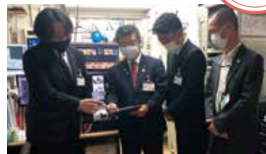
警備室での認定審査