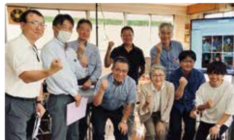
第五回認定試験会場にて