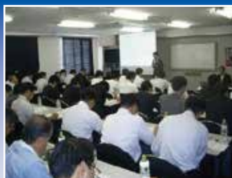
万引防止システムの基礎知識取得のためのJEAS検定講習会の様子です。現在はオンラインでも受講できます。

コロナ禍以降においては、JEASの役割を「誰もが安全・安心を享受できる防犯民主主義実現の旗の下、EAS機器と防犯カメラとロス・プリベンション推進のための工業会」とし、「協働防犯」を合言葉に、マルチステークホルダーとの対話促進および現場力向上の両立に重点をおき、Think Globally, Act Locally(超訳：一隅を照らすは、これ則ち世界の宝なり)という視点で、米国や中国などのロス・プリベンション組織とも連携しながら、集団窃盗団対策やセルフレジ不正防止などの新たな課題に対応しております。