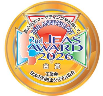
本年度の金賞デザイン

※第3部の会員参加費はお一人4,000円(税込)です。なお、日頃より会員がお世話になっている来賓や小売業の皆様、学生を含むアカデミアの皆様はご招待となります。来賓には元法務大臣で衆議院議員の葉梨康弘様(自民党の防犯&サイバーの委員会責任者)、日本リテリングセンター代表 渥美六雄様などにお越しいただけるよう調整をしております。