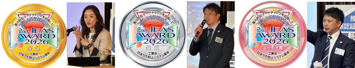
高千穂交易(株)日向様