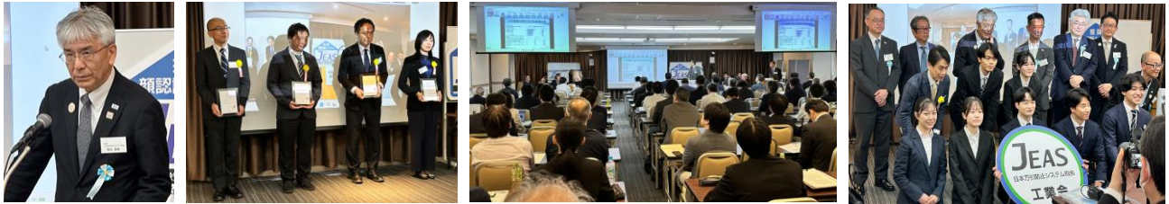
新役員(4名)と新会員挨拶(5社)

通常総会の会長挨拶、感謝状贈呈、万引防止システムの市場調査報告、創価大安田ゼミの方々と